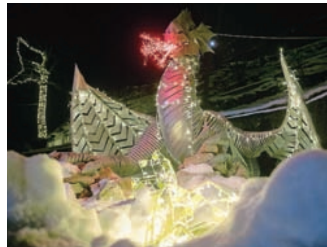
Skulptura zmaja z jajcem