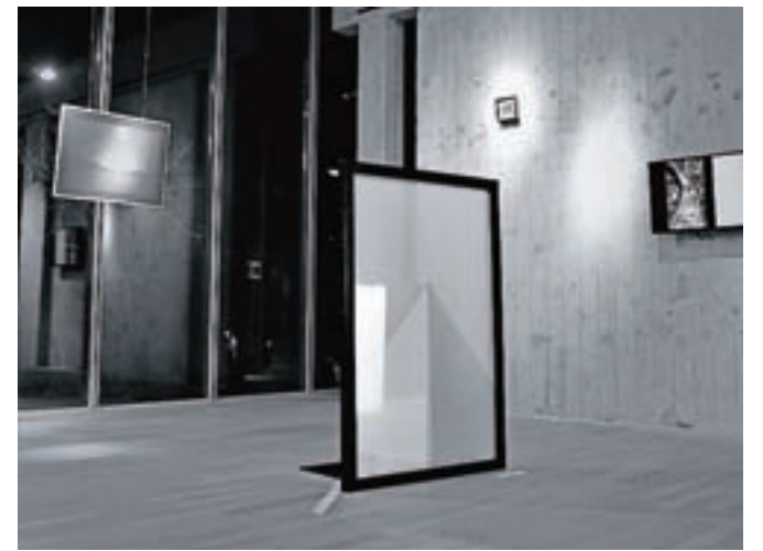
Razstava gledalca vabi k razmisleku o njem samem in svetu, v katerem živimo.

likovnih ciklusih in motivih načrtno prehaja med različnimi likovnimi mediji in jih povezuje med seboj. Veliko njenih del se navezuje na družbo in naravo v domačem okolju in tudi kot osrednji tematski fokus razstave v Paviljonu NOB je izbrala dom. Na ogled so bila dela, povezana z njeno raziskavo in koncepti iz serije Čas – oko – telo ter eksperimentalne fotografije s camera obscura iz projekta Rekonstrukcija projicirane slike.