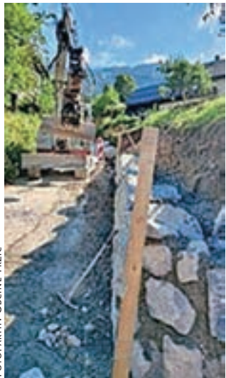
Novi oporni zid na Zgornjem Vetrnem

Letos so sanirali najbolj poškodovan odsek vozišča pri križišču za deponijo Kovor in uredili odvodnjavanje. V Kovorju so zgradili 265 metrov hodnika za pešce, uredili dva prehoda za pešce in postavili novo javno razsvetljavo, sanirali vozišče v dolžini skoraj dvesto metrov in na novo uredili meteorno kanalizacijo. Zgrajeni so tudi novi podporni in oporni zidovi v dolžini 42 metrov. Mimo Gasilskega doma v Kovorju je spremenjen prometni režim, urejena slepa ulica s cono umirjenega prometa in dograjeno telekomunikacijsko omrežje.