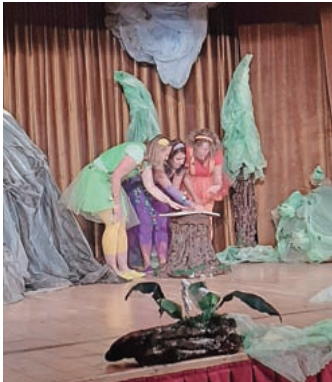
V šentanski gozd, najbrž na področje današnje Čarovce, pridejo tri damice, izvirno domače poimenovane čaruhle, ki svojih čarobnih moči še niso dodobra odkrile ...