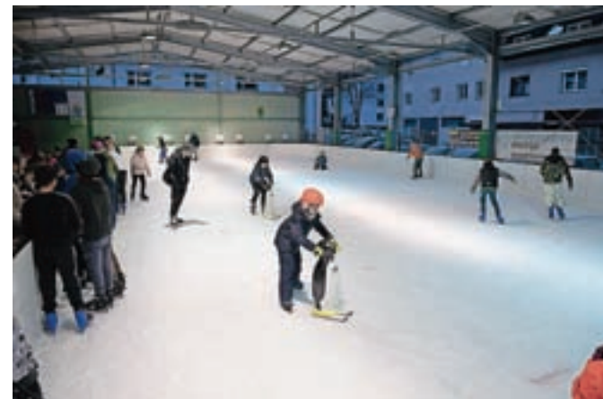
Rekreacijsko drnanje na Ravnah. Slika je simbolična.