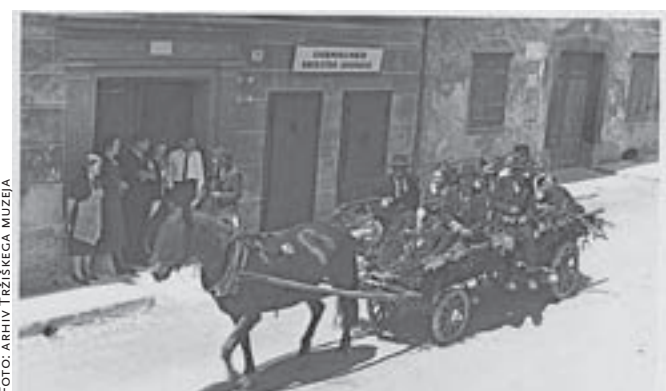
Pri Kristanu/pri Urmoharju na Trgu svobode 29 v Tržiču