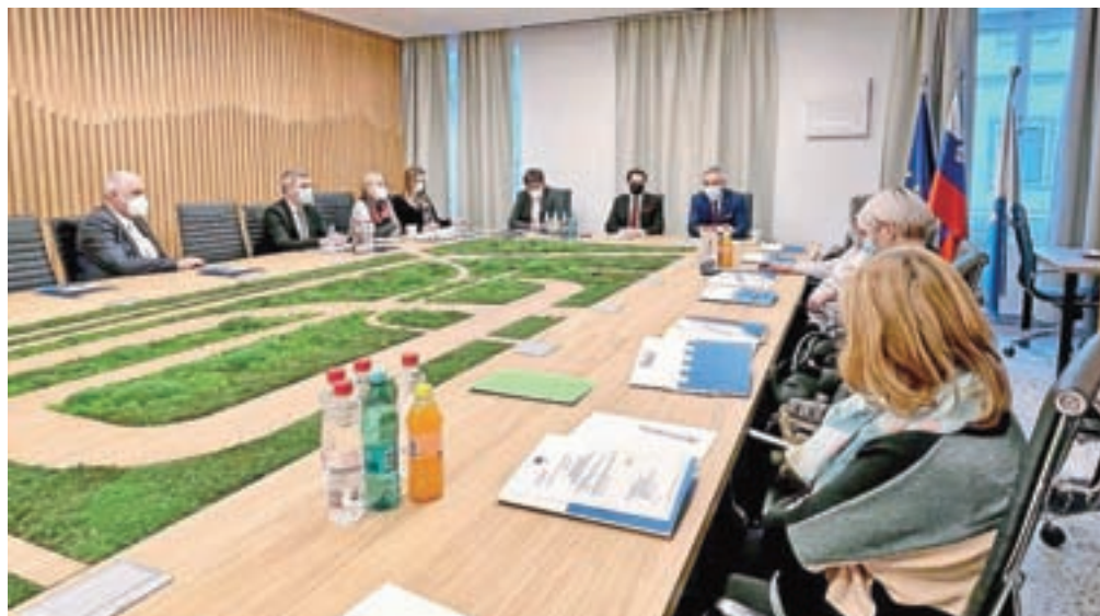
Na šesti redni seji Sosveta starejših Občine Tržič je sodeloval tudi minister Janez Cigler Kralj.

V okviru regijskega obiska vlade je bilo v Tržiču tudi srečanje ministra za javno upravo Boštjana Koritnika in državne sekretarke Urške Ban z župani gorenjske statistične regije. Gostitelj tržiški župan Borut Sajovic je opozoril na problematiko učinkovitosti pri izdaji gradbenih dovoljenj. "Prosimo za pomoč in dodatne zaposlitve na Upravni enoti Tržič,