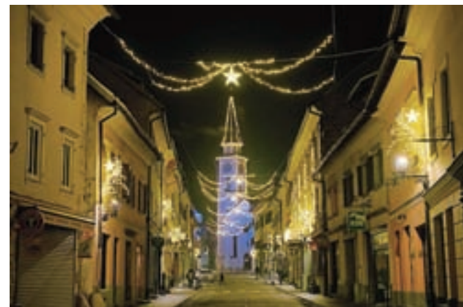
Praznično okrašeno staro mestno jedro.

ski ulici, Partizanski ulici, delu Cankarjeve in Koroške ceste, atriju Občine Tržič, Tržiškem muzeju, Kurnikovi hiši in vseh treh mostovih čez Tržiško Bistrico.