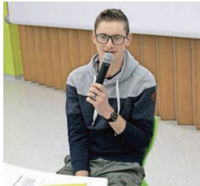
Obiskal nas je kolesar Matej Mohorič.

V knjižnici smo letos še posebno pozornost posvetili spodbujanju branja pri otrocih in mladih, kajti epidemija je mnoge prikrajšala za stik s knjižnico. Potreba po novem projektu za spodbujanje branja se je pokazala zlasti pri učencih zadnje triade, pri katerih je upad zanimanja za branje v primerjavi z učencih nižjih razredov še posebno opazen. Z mislijo, da je to populacija, ki v mladih zvezdnikih išče svoje idole in veliko časa preživi na družbenih omrežjih, hkrati pa jo čaka odločitev za vpis na srednjo šolo in s tem morda tudi že odločitev za izbiro poklica, smo se odločili, da spodbujanje branja združimo s poklicno orientacijo, hkrati pa otroke povabimo k aktivnemu sodelovanju s knjižnico na družbenih omrežjih. Tako je nastal projekt Drzni.si, ki se je začel 2. novembra 2021 in se bo zaključil 6.