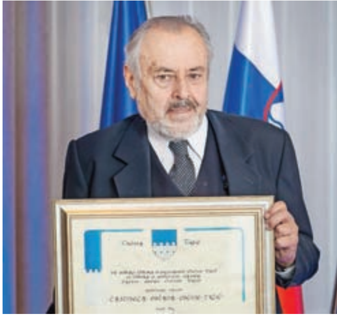
Ernest Petrič

Svoje delo, znanje in razmišljanja je zapisal v več kot desetih znanstvenih monografijah. Opravljal je mnogo strokovnih, političnih in vodstvenih funkcij, med drugimi je bil poslanec republiške skupščine Socialistične republike Slovenije (SRS), član izvršnega sveta (vlade) SRS, član Ustavne komisije republiške skupščine SRS, veleposlanik Jugoslavije v Indiji in Nepalu, predstavnik in veleposlanik Republike Slovenije v ZDA, Avstriji in Mehiki, stalni predstavnik in veleposlanik Republike Slovenije pri OZN v New Yorku in na Dunaju ter član svetov in odborov številnih domačih in mednarodnih akademskih in raziskovalnih institucij, sodnik Ustavne sodišča Republike Slovenije in predsednik tega sodišča. Še danes opravlja funkcijo člana Svetovalnega odbora za izbiro sodnikov Mednarodnega kazenskega sodišča v Haagu, člana Strateškega sveta pri slovenskem Ministrstvu za zunanje zadeve, svetovalca za mednarodne odnose in mednarodno pravo predsednika Republike Slovenije in člana Beneške komisije pri Svetu Evrope. V svoji karieri je prejel mnoga odlikovanja in priznanja, bil je prejemnik viso-