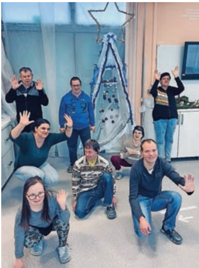
Decembra uporabniki skupaj z zaposlenimi enoto praznično okrasijo.

Uporabnikom ponujajo tudi kulturne, izobraževalne, športne, družabne in druge