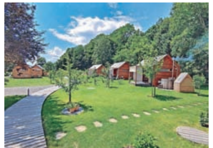
Glamping v gorski pravljici

"V podjetju Magnocor smo izredno ponosni, da smo prejeli priznanje ambasador občine Tržič. Ta naziv nam pomeni veliko nagrado za opravljeno delo v preteklih štirih letih ter odlično motivacijo za nadaljnji razvoj glampinga v gorski pravljici. Za največji uspeh si štejejo, da nam je uspelo povezati veliko število lokalnih