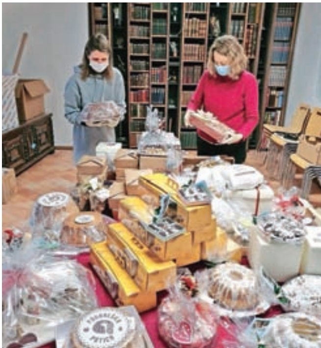
Deseta dobrodelna dražba prazničnih slaščic je potekala v nekoliko prilagojeni obliki.

dobrodelno poslanstvo, ki družni somišljenike v Rotary in Lions klubih po vsem svetu. Obenem bomo na ta način praznično vzdušje soustvarjali tudi za tiste, ki sicer praznikov zaradi tež-