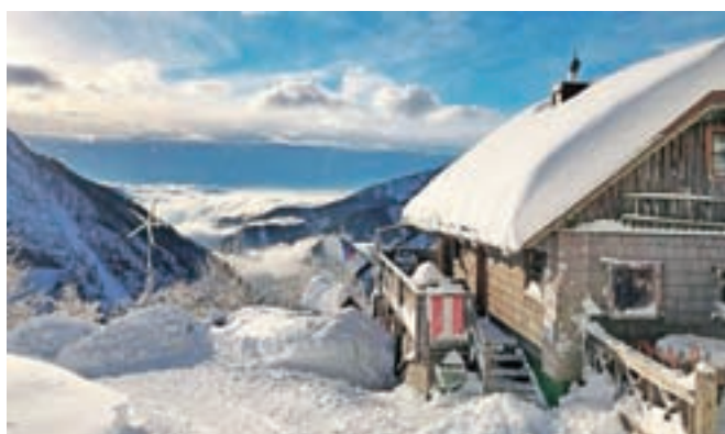
Kočja na starem Ljubelju je vse leto odprta od srede do nedelje od 8. do 17. ure, le 24. in 31. decembra do 15. ure.

narekujejo koronavirusne razmere in ukrepi. Iz PD Križe so sporočili, da je odprta kočja na Kriški gori in tudi Zavetišče v Gozdu posluje po rednem obratovalnem času. Odprt je tudi Taborniški dom Šija. Več informacij o delovnem času je na voljo na spletnih straneh ponudnikov.